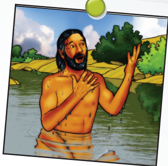
Elisée leçon 4