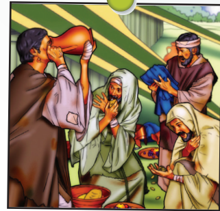
Elisée leçon 6

Bonne nouvelle : Dieu est venu à notre secours !