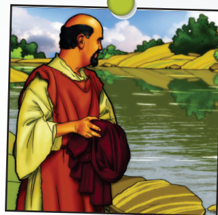
Elisée leçon 1

Servir Dieu signifie se mettre au service des autres. Avec les enfants, rédigez une liste d'une dizaine de personnes de votre famille ou de votre entourage qui ont besoin d'aide dans un domaine ou un autre. Placez ensuite la liste au centre de la table et proposez à chacun de choisir secrètement une personne, puis de mimer l'aide qu'il lui apporte. Les autres devront deviner de quel service il s'agit et auprès de quelle personne il le rend. Lisez ensemble Galates 6.10 et engagez-vous à rendre service à une des personnes de la liste au cours du mois.