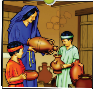
Elisée leçon 2

Verset de la semaine Mon Dieu subviendra pleinement à tous vos be- soins ; il le fera, selon sa glorieuse richesse qui se manifeste en Jésus-Christ. Philippiens 4.19