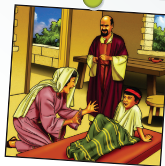
Elisée leçon 3

Dieu peut faire l'impossible car il est tout-puissant.