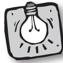
Illustration : paroles de Cerf-volant

Demander à Dieu la sagesse. [Feuille de travail.] Elle te permettra de regarder les difficultés sous un nouvel angle et de demeurer heureux et reconnaissant. Si tu demandes la sagesse avec foi, croyant que Dieu peut et veut te l'accorder, Dieu te la donnera. Il est bon et généreux. Tu n'auras plus le même regard sur l'épreuve.