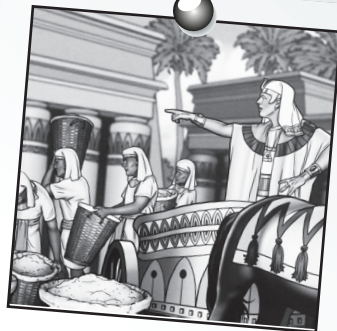
Joseph leçon 4

Dieu a des projets pour ses enfants qu'il est capable de réaliser.