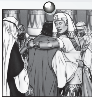
Joseph leçon 5

Révision des versets précédents Psaume 121.5, 145.9 et Jérémie 29.11