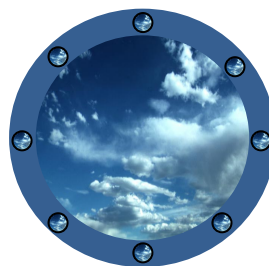
A mettre à l'intérieur de l'avion