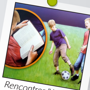
Rencontrer l'Auteur leçon 5 : Le Saint-Esprit fortifie les enfants de Dieu.

A lire Romains 8.26 Actes 1.8 Jean 14.26-27 Jean 16.13 Ephésiens 4.30,32 Esaie 63.10