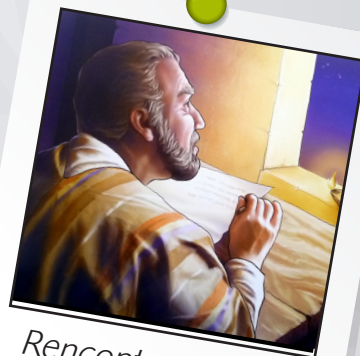
Rencontrer l'Auteur leçon 2 : Le Saint Esprit nous a donné la Bible

L'Esprit Saint a soufflé pour que la Bible atteigne l'objectif donné par Dieu : donner Sa parole aux hommes et leur montrer tout son amour.