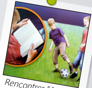
Rencontrer l'Auteur leçon 5 : Le Saint-Esprit fortifie les enfants de Dieu.

A lire Romains 8.26 Actes 1.8 Jean 14.26-27 Jean 16.13 Ephésiens 4.30,32 Esaie 63.10