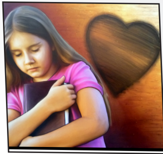
Rencontrer l'auteur Leçon 4 : Le Saint Esprit est le compagnon des croyants

Verset de la semaine "Celui qui est en vous est plus grand que celui qui est dans le monde." 1 Jean 4.4