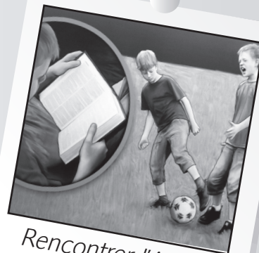
Rencontrer l'Auteur leçon 5 : Le Saint-Esprit fortifie les enfants de Dieu.

Prenez une loupe, votre Bible et réunissez votre famille. Amusez-vous à lire le texte biblique avec la loupe. C'est marrant de voir comment les mots ressortent. Cela peut nous faire penser à la façon dont l'Esprit travaille en nous quand nous lisons la Bible. Il arrive qu'une parole ressorte du texte et nous touche. Parents et enfants peuvent donner des exemples de passages qui les ont marqués par le passé et expliquer comment l'Esprit s'en est servi dans leur vie.