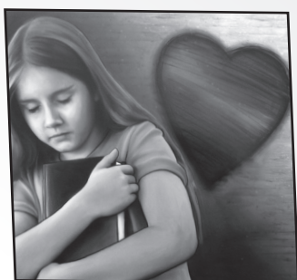
Rencontrer l'auteur Leçon 4 : Le Saint Esprit est le compagnon des croyants

Verset de la semaine "Celui qui est en vous est plus grand que celui qui est dans le monde." 1 Jean 4.4