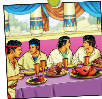
Daniel leçon 1

Des personnes ou des choses peuvent nous pousser à faire ce qui déplaît à Dieu. Demandez aux enfants de vous citer des exemples de pressions qui s'exercent sur eux (les mauvais amis, internet, certaines musiques, la peur des autres...) Notez ces mots sur une bouteille vide au marqueur. Celle-ci servira d'illustration dans la prochaine activité.