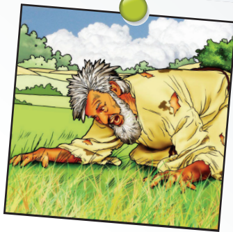
Daniel leçon 4

A lire Daniel 4.25-33 Dieu domine sur toutes choses.