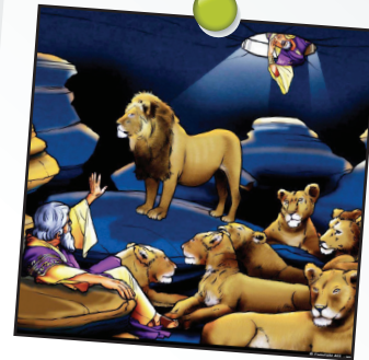
Daniel leçon 6

Reste fidèle à Dieu et compte sur son secours.