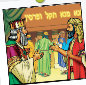
Daniel leçon 5

A l'abri des regards, prenez deux tubes en carton. Coupez le premier sur la longueur et enroulez-le dans un chiffon blanc. Introduisez ce tube dans le deuxième de façon à ce que le chiffon soit invisible et que le tube semble vide. Expliquez aux enfants que nous aussi, nous commettons des actes injustes. Nous avons besoin que nos fautes soient effacées pour pouvoir vivre avec Dieu. Heureusement Jésus est intervenu. Il a pris notre punition et effacé nos fautes. Sur le tube extérieur, écrivez les mots 'par le sacrifice de Jésus'. Montrez aux enfants l'intérieur vide, puis introduisez un chiffon sale par une extrémité. Tout en maintenant ce dernier, tirez sur le chiffon blanc de l'autre côté. En mettant notre confiance en Jésus, nos fautes sont effacées.