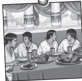
Daniel leçon 1

Des personnes ou des choses peuvent nous pousser à faire ce qui déplaît à Dieu. Demandez aux enfants de vous citer des exemples de pressions qui s'exercent sur eux (les mauvais amis, internet, certaines musiques, la peur des autres...) Notez ces mots sur une bouteille vide au marqueur. Celle-ci servira d'illustration dans la prochaine activité.