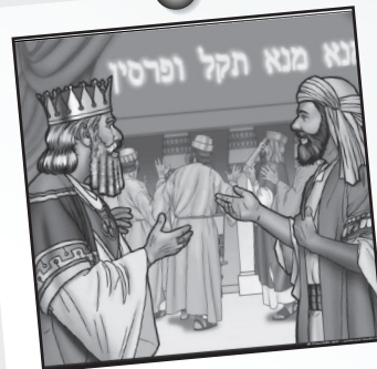
Daniel leçon 5

A l'abri des regards, prenez deux tubes en carton. Coupez le premier sur la longueur et enroulez-le dans un chiffon blanc. Introduisez ce tube dans le deuxième de façon à ce que le chiffon soit invisible et que le tube semble vide. Expliquez aux enfants que nous aussi, nous commettons des actes injustes. Nous avons besoin que nos fautes soient effacées pour pouvoir vivre avec Dieu. Heureusement Jésus est intervenu. Il a pris notre punition et effacé nos fautes. Sur le tube extérieur, écrivez les mots 'par le sacrifice de Jésus'. Montrez aux enfants l'intérieur vide, puis introduisez un chiffon sale par une extrémité. Tout en maintenant ce dernier, tirez sur le chiffon blanc de l'autre côté. En mettant notre confiance en Jésus, nos fautes sont effacées.