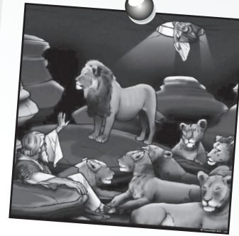
Daniel leçon 6

Reste fidèle à Dieu et compte sur son secours.