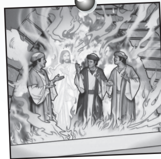
Daniel leçon 3