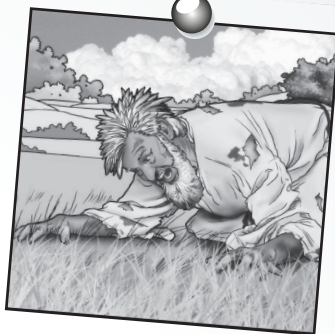
Daniel leçon 4

A lire Daniel 4.25-33 Dieu domine sur toutes choses.