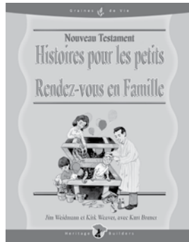
Nouveau Testament Histoires pour les petits