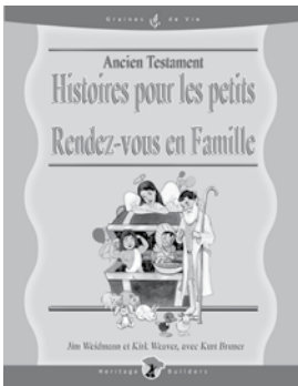
Ancien Testament Histoires pour les petits