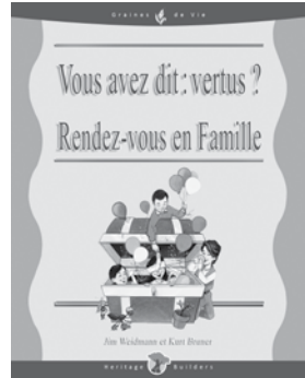
Vous avez dit : vertus ?