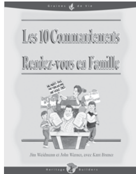
Les 10 commandements